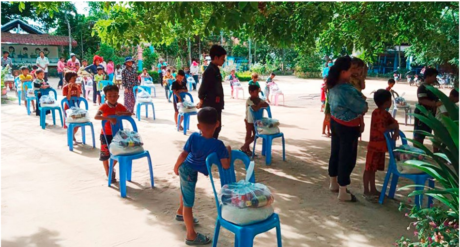
Distribution de colis alimentaires

Le Child Migrant Office a continué à travailler avec les autorités locales pour soutenir les migrants de retour de Thaïlande en leur fournissant des denrées alimentaires et des articles d'hygiène de base pendant leur période de quarantaine (14 jours). Le personnel du ChildSafe à Poipet a également mis en place 16 mini centres Drop In dans leurs propres maisons afin de faciliter l'accès à l'aide et de fournir des conseils aux enfants et familles de la province dont les moyens de subsistance avaient été gravement affectés par la pandémie. Les éducateurs ont dispensé des cours aux enfants et leur ont transmis des compétences de vie et des informations sur les droits des enfants, la migration et l'importance de l'éducation scolaire.