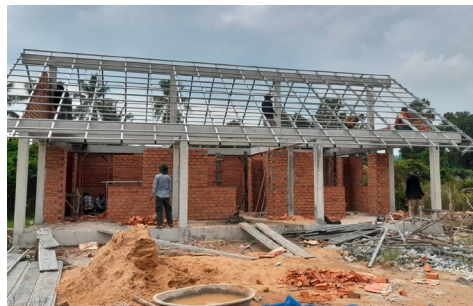
Les nouveaux bungalows résidentiels prennent lentement forme.